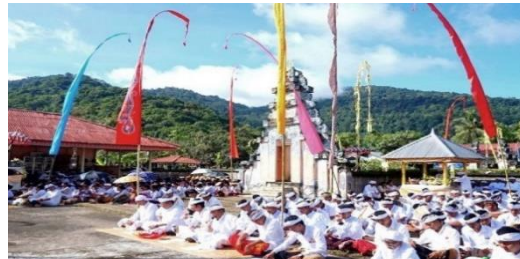
Gambar 2. Masyarakat Bali Desa Sedahan Jaya Melakukan Upacara Keagamaan