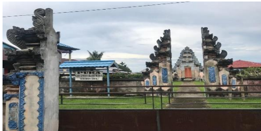
Gambar 1. Pura masyarakat Bali Desa Sedahan Jaya Sumber: Dokumentasi Probadi, 2022

Pada awalnya kedatangan mereka di Desa Sedahan Jaya ini menempati lahan kosong yang kemudian dinamakan sebagai kompleks Bali. Masyarakat Bali hidup secara mengelompok guna melestarikan kebudayaan asli mereka. Kemudian pada tahun 1977 masyarakat Bali membangun sebuah pura yang dikenal sebagai Pura Giriamerthabuwana . Pura tersebutlah yang menandakan bahwa adanya pengelompokan masyarakat Bali dengan berbagai kebudayaan dan tradisi asli masyarakat Bali. Seiring berjalannya waktu, kepadatan penduduk Bali yang terdapat di Komplek Bali mengalami peningkatan yang signifikan yang mengakibatkan banyaknya penyebaran penduduk Bali di Desa Sedahan Jaya hingga ke Dusun Begasing serta membangun beberapa pura baru sebagai aktivitas peribadatan mereka.