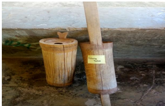
Gambar 7. Bo'Bo

Bo'Bo adalah alat musik yang pada umumnya sudah dikenal oleh masyarakat Indonesia yaitu dengan sebutan kentong. Etnis Kamang bukapiting menamakan Mabai , etnis Abui takalelang menyebutnya Mai Tuku atau Bakbak dan lain-lain. Samapi masa sekarang, alat musik ini difungsikan untuk mengusir binatang pemakan tanaman dan sebagai tanda pemberi informasi kehadiran pemilik ladang sedang berada dikebunnya.