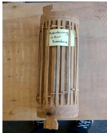
Gambar 8. Kediding

Tidak diketahui secara pasti kediding diciptakan oleh siapa dan tahun berapa, namun alat musik ini sudah ada sejak masa dahulu yang digunakan oleh masyarakat Alor sebagai musik ladang untuk menghilangkan rasa penat dan sepi ketika bekerja diladang. Alat musik ini pada etnis kabola disebut Adiding , etnis lembur tengah disebut Makebing dan lain-lain. Bahan untuk membuat alat musik ini yaitu seruas bambu biasa yang bagus dan utuh. Bambu tersebut dipotong membentuk 6 dawai/senar yang ditengahnya dibuat lubang resonansi. Nada yang dihasilkan disesuaikan dengan nada gong asli. Jadi orang yang memainkan alat musik kediding harus mampu memahami bunyi dan irama dari gong asli. Alat musik petik ini bisa juga dimainkan dengan menggunakan bantuan kulit kenari yang ditipiskan atau belahan bambu untuk memetikanya. Seperti penjelasan sebelumnya, maka musik ini dalam ansambel musik Pitung dal bisa digunakan sebagai pengganti gong atau juga dimainkan sebagai pembawa harmoni.