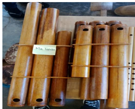
Gambar 4. Ma Tawa

Bahan dasarnya alat musik ma tawa terbuat dari bambu licin tua yang tipis. Salah satu bukannya di potong. Pada bagian dekat buku yang utuh dilubangkan menjadi lubang tiup. Masing-masing ruas bambu mewakili satu nada. Kemudian dijepit dan diikat menjadi satu set ma tawa yang memiliki 3 nada. Setiap nada dasar mempunyai ukurannya sendiri-sendiri.