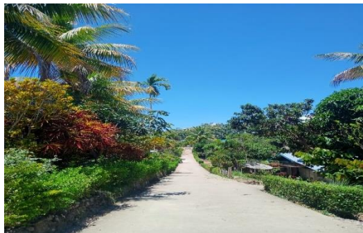
Gambar 1. Desa Luba