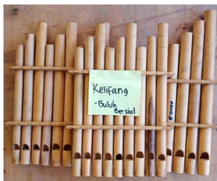
Gambar 5. Ke Lifang

Ke lifang merupakan salah satu alat musik jenis tiup yang terbuat dari bambu. Istilah ke lifang terdiri dari 2 kata yaitu ke artinya buluh, dan lifang artinya bersiul. Jadi ke lifang artinya bambu bersiul, menurut sebutan etnis Kamang Apangba. Bahan dasar pembuatan ke lifang yaitu batang buluh tua yang tipis, kayu untuk membuat sumbatan tiup. Sabut kelapa atau karet untuk sumbatan pada tabung resonansi yang berfungsi juga sebagai pengatur nada. Masing-masing buluh mewakili sebuah nada yang dirangkai menjadi sebuah alat musik harmoni yang disebut ke lifang .