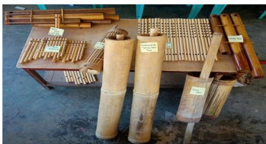
Gambar 2. Ansambel Musik Pitung Dal

seniman dan pengrajin musik bambu sejarahnya, dimulai dengan menciptakan alat musik bambu yang pertama yaitu a kanui yang dimainkan dengan cara ditiup. A Kanui berasal dari kata A artinya padi, dan kanui artinya suling. Menurutnya, alat musik ini dimainkan untuk menghibur selama bekerja diladang dan juga ditiup sebagai tanda untuk mengumpulkan masyarakat Alor dalam suatu pertemuan dan juga mengenang arwah orang yang sudah meninggal. Dari a kanui ini, kemudian diciptakan lagi alat musik bambu lainnya yang namun tidak diketahui secara pasti tahun dan siapa yang menciptakannya. Alat musik bambu yang sudah diciptakan kemudian disatukan dan dikemas menjadi satu kelompok musik ansambel oleh Almarhum Bapak Nathan Maukoli tahun 2006 yang sekarang dikenal dengan nama musik pitung dal . Alat musik bambu itu antara lainnya yaitu kanui pup , ma tawa , kelifang , feting taba tiup , bo'bo , dan feting taba pukul .