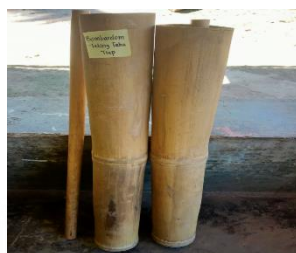
Gambar 6. Feting Taba Tiup

Bahan dan cara pembuatan feting taba atau bombardom yaitu terbuat dari bambu betung yang tua untuk tabung resonansinya dan selinder peniupnya dipakai bambu licin tua yang tipis atau buluh yang berdiameter besar. Ukuran panjang betung 1 ½ ruas. Bentuk dan ukurannya dapat dilihat pada gambar di bawah ini.