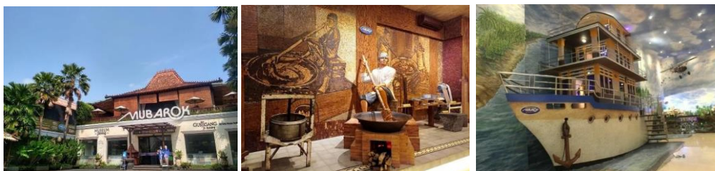
Gambar 4. Rumah Adat Jenang Kudus

Subjek penelitian ini bertempat di salah satu fasilitas Jenang Kudus yaitu “Jenang Kudus Sinar Tiga-Tiga”. Terletak di dalam pabrik dan kompleks perbelanjaan Jenang. Struktur fisik Rumah Suci telah mengalami beberapa kali pemugaran. khususnya pada bagian struktur ruang bagian dalam dihancurkan untuk memberi ruang bagi gudang dan lokasi pembuatan jenang (Trihanondo, 2024).