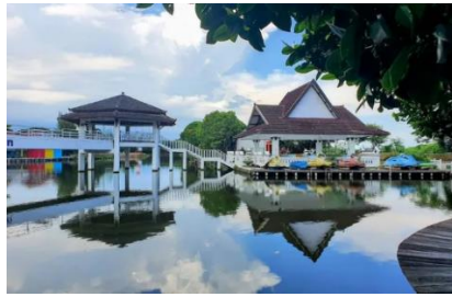
Gambar 2. Rumah Adat Puri Maerokoco