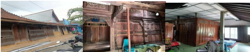
Gambar 3. Rumah Adat Kudus Desa kauman

Subyek penelitian ini terletak di Desa Kauman, Kabupaten Kota, dan Kabupaten Kudus, sebelah selatan Menara Kudus. Pemukiman Kauman terletak di Jalan Menara. Meskipun struktur fisiknya telah dibangun kembali, masih terdapat banyak rumah adat Kudus yang masih utuh secara fisik. Dengan ciri khas berupa ukiran kayu yang spektakuler dan memiliki tingkat kerumitan yang tinggi. Pemimpin keluarga sering tinggal di rumah adat ini yang telah mengalami beberapa perubahan desain dari rumah konvensional. Rumah-rumah kuno ini telah mengalami renovasi interior dan eksterior.