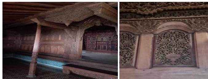
Gambar 5. Ruang Jogosatru

Ruang Jogosatru digunakan untuk menerima tamu. memiliki material dan dekorasi yang paling mencolok. "Jogo Satru" berarti "menjaga (melawan) musuh", Dua sisi kiri digunakan untuk menampung tamu pria, sedangkan sisi kanan untuk menampung tamu wanita. Penataan furnitur dan jumlah kursi yang ditempati bervariasi. memiliki maksud dan tujuan tersendiri. Keempat item sampel yang digunakan semuanya memiliki tujuan yang sama, yaitu menyediakan tempat bagi pemilik tempat tinggal untuk bersantai atau tidur.. Di dalam ruang Dalem yang dibiarkan kosong untuk mushola, terdapat sebuah ruangan di dalam rumah adat Museum Kretek bernama Gedongan.