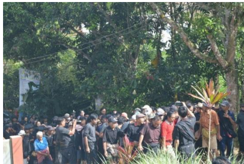
Gambar 2. Pengusungan jenazah ke liang kubur dari rumah duka

Berbagai metode pengabaran Injil firman Allah dan nyanyian Kristen diaplikasikan oleh Zending, antara lain para utusan Zending dibantu oleh guru-guru sekolah yang berasal dari Ambon, Manado, dan Sangir. Sekolah adalah sarana yang sangat efektif dalam pembaruan masyarakat Toraja termasuk Injil Kristen. Zending GZB telah membuka sekolah rakyat yang menyebar sampai pelosok-pelosok daerah Toraja. Nyanyian Penanian Dolo sering diajarkan dan dinyanyikan oleh para siswa di sekolah pada masa itu kemudian saat ini dilestarikan oleh masyarakat Gandangbatu Sillanan yang dikemas dalam upacara kematian. Musik dan tarian telah lama berperan penting dalam kehidupan budaya masyarakat Sulawesi Selatan (Sutton, 1995, p. 672)