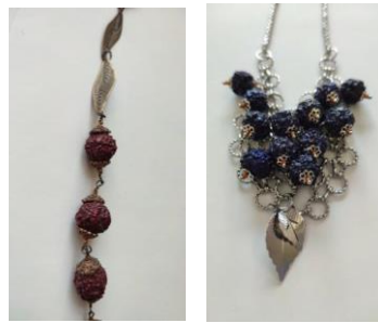
Gambar 8. Gambar 7. Karya Biji Jenitri dengan Bahan Lainnya

Peneliti bekerjasama dengan mitra LORI aksesoris membuat kuesioner untuk mempertajam kebutuhan masyarakat akan aksesoris yang menggunakan biji Jenitri yang disesuaikan dengan kebutuhan masa kini. perajin LORI membuat aksesoris menggunakan bahan biji Rudraksha, sehingga kebutuhan penelitian dapat semakin baik hasilnya. berikut pertanyaan-pertanyaan yang telah diajukan ke responden customer LORI.