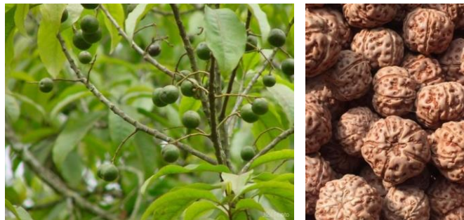
Gambar 1. Pohon dan Buah Jenitri

Biji Ganiri mempunyai tekstur yang sangat indah, hal ini menjadi daya Tarik bagi desainer untuk dapat mengolah menjadi aksesoris kontemporer berupa kalung anting, gelang, bros, dll. kira-kira 150 tahun yang lalu Mukti, seorang India yang tinggal di Kebumen memberikan bimbingan menanam pohon jenitri (yang dikenal dengan nama rudraksha) hingga panen.