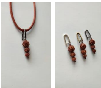
Gambar 7. Karya Biji Jenitri dengan Bahan Lainnya