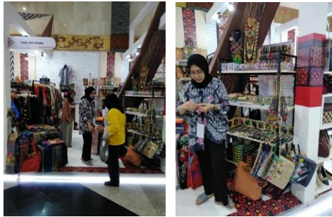
Gambar 4. Pameran Inacraft (Jakarta Convention Centre)

Berikut ini foto aksesoris yang menggunakan bahan biji Jenitri dan beredar di pasaran. Dapat kita lihat bahwa pengembangan desainnya masih terbatas. Ada yang sudah digabungkan dengan material lain dan ada yang belum.