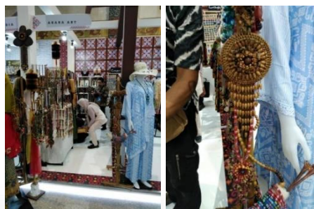
Gambar 3. Pameran Inacraft (Jakarta Convention Centre)