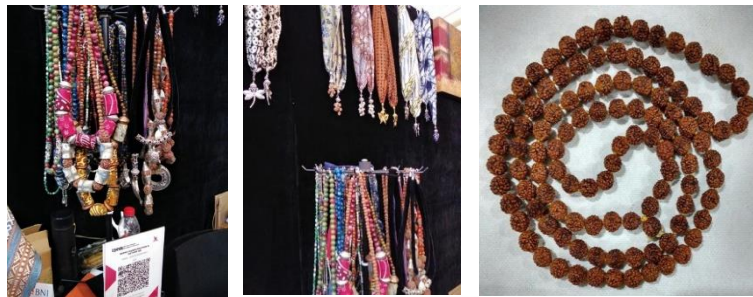
Gambar 5. Karya-Karya Biji Jenitri

Berikut ini foto aksesoris yang menggunakan bahan biji Jenitri dan beredar di pasaran. Dapat kita lihat bahwa pengembangan desainnya masih terbatas. Ada yang sudah digabungkan dengan material lain dan ada yang belum.