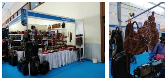
Gambar 2 Pameran Inacraft (Jakarta Convention Centre)

CV ubud Corner, UC Silver Gold, Hana, Marsumelita Craft, Surya Silver GK Yogyakarta, Florent Jewelry, membuat perhasan dari perak dan Pearl. Mereka bisa saling bertukar pengalaman juga matrial yang digunakan termasuk cara memperoleh matrial serta saling tukar informasi apabila ada workshop, seminar dan bahkan pameran.