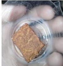
Gambar 5. Olahan Gambir