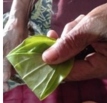
Gambar 10. Bentuk lipatan Daun Sirih