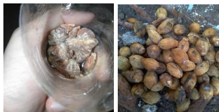
Gambar 4. Biji Pinang yang Sudah Dipotong Kecil-Kecil dan Buah Pinang

Buah pinang berbentuk bulat, kadang juga berbentuk lonjong. Bagian dari buah pinang yang biasa digunakan untuk nyisig ialah bagian bijinya. Biji buah pinang terdapat serat-serat berwarna coklat dan putih. Biji buah pinang memiliki rasa yang kelat serta agak terasa pahit (Mauliddah, 2021).