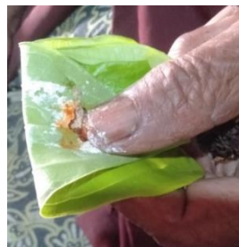
Gambar 12. Pemberian Biji Pinang dan Olahan Gambir pada Daun Sirih