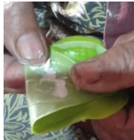
Gambar 11. Pemberian Kapur pada Daun Sirih