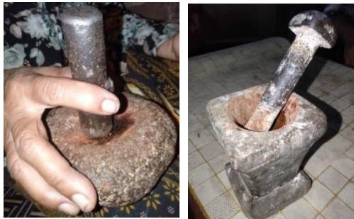
Gambar 9. Ketokan

Ketokan merupakan alat yang digunakan untuk menumbuk bahan-bahan nyisig . Alat ini terdiri dari dua jenis yakni tempat menumbuk dan alat penumbuknya. Tempat menumbuk terbuat dari batu yang berbentuk cekung, sedangkan alat penumbuknya terbuat dari besi. Ketokan ini membantu dalam menghaluskan bahan-bahan nyisig karena kondisi giginya yang sudah habis (Wawancara dengan Mbah Salma pada 30 Desember 2023). Ketokan itu banyak macamnya, tidak semua terbuat dari batu ada juga yang terbuat dari kayu seperti pada gambar kedua yakni tempat menumbuknya terbuat dari kayu sedangkan penumbuknya dari besi.