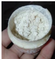
Gambar 6. Kapur