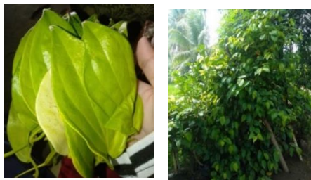
Gambar 3. Daun Sirih Hijau dan Tanaman Sirih Hijau

Tanaman sirih hijau merupakan salah satu tanaman yang tumbuh dengan cara menjalar pada tempat hidupnya seperti dibatang tumbuhan lain. Biasanya tanaman sirih hijau ditanam warga di halaman rumahnya. Daun sirih memiliki ujung yang runcing serta berwarna hijau muda dan hijau tua (Mauliddah, 2021).