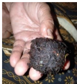
Gambar 5. Olahan Tembakau