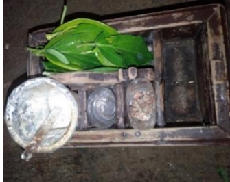
Gambar 8. Wanci Kinangan

Wanci Kinangan merupakan tempat menyimpan bahan-bahan yang digunakan untuk nyisig . Wanci kinangan ini memiliki lima ruang penyimpanan yakni diantaranya tempat menyimpan kapur, biji pinang, gambir, daun sirih hijau serta tempat menyimpan alat penumbuknya (Wawancara dengan Mbah Kaseh pada tanggal 25 Desember 2023). Mbah Salma menuturkan bahwasannya wanci kinangan miliknya terbuat dari kayu jati, usia wanci tersebut sudah tua, sejak ia pertama kali nyisig . Jaman sekarang susah mencari orang yang jual wanci kinangan (Wawancara dengan Mbah Salma pada tanggal 30 Desember 2023; wawancara dengan Mbah Utin pada tanggal 19 Desember 2023).