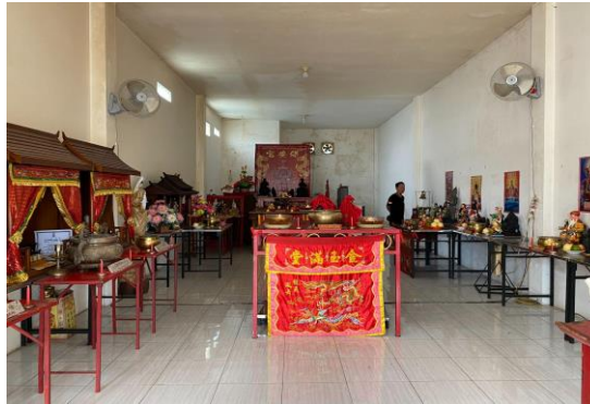
Gambar 6. Ruang Lantai Dua Ruko untuk Sembahyang