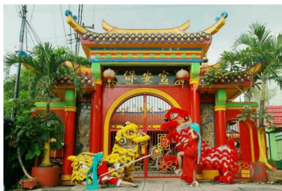
Gambar 1. Kelenteng Poo An Kiong Sebelum Kebakaran (Dokumentasi Pengurus Kelenteng)

Bangunan Kelenteng Poo An Kiong Kota Blitar memiliki empat bagian, di antaranya lantai satu ruang bagian depan dan ruang utama atau inti di bagian tengah. Kemudian ruang di bagian belakang serta ruangan lantai dua berada dalam satu bangunan. Fungsi lantai satu bagian ruang utama dan lantai dua sama-sama digunakan untuk sembahyang dan peletakan patung-patung sakral yang ada di Kelenteng Poo An Kiong. Perbedaan antara lantai satu dengan lantai dua adalah ruang utama lantai satu terdapat tujuh altar di mana salah satunya altar untuk patung tuan rumah Kong Tik Cun Ong, sementara di lantai dua terdapat lima altar mulai dari altar patung dewi Kwan Im hingga patung perwakilan tiga ajaran yaitu Konghucu, Taoisme, dan Buddha.