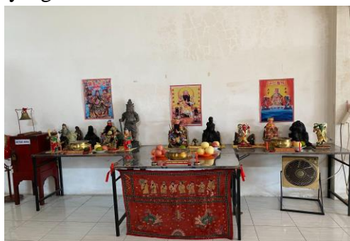
Gambar 4. Patung-Patung Kelenteng Poo An Kiong di Lantai Dua Ruko

baru. Berbagai peralatan seperti altar, patung, dan peralatan lainnya yang digunakan untuk sembahyang oleh umat kelenteng diletakkan di lantai dua ruko. Sementara itu, di lantai satu ruko digunakan sebagai kantor sekretariat Kelenteng Poo An Kiong. Selain itu, di lantai satu ruko juga dijadikan sebagai tempat untuk perjamuan dan makan-makan yang dilakukan secara sederhana pada hari-hari perayaan yang telah menjadi tradisi etnis Tionghoa itu sendiri. Saat pemindahan seluruh peralatan dan patung selesai dilakukan, bangunan Kelenteng Poo An Kiong dirubuhkan secara total untuk dibangun ulang pada bulan Juni 2022. Semenjak saat itu, seluruh kegiatan dilakukan di ruko Kantor Sekretariat Sementara Kelenteng Poo An Kiong. Di ruko tersebut, pelaksanaan kegiatan masih tetap diberlakukan pembatasan jumlah karena keterbatasan tempat di ruko yang kecil.