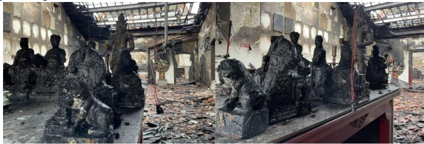
Gambar 3. Kondisi Patung-Patung Setelah Kebakaran (Dokumentasi Pengurus Kelenteng)