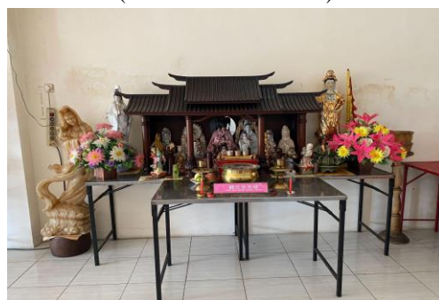
Gambar 5. Patung-Patung Kelenteng Poo An Kiong di Lantai Dua Ruko (Dokumentasi Pribadi)

Pelaksanaan sembahyang dan perayaan-perayaan lainnya seperti Tahun Baru Imlek pada tahun 2023 juga masih diberlakukan himbauan pembatasan. Namun, pada tahun ini kegiatan sembahyang sudah tidak hanya dilakukan oleh para pengurus saja. Meskipun jumlahnya masih sedikit karena kapasitas di ruko kecil, para umat kelenteng sudah mulai dapat melakukan sembahyang di ruko Sekretariat Sementara Kelenteng Poo An Kiong. Pada tahun 2024, pelaksanaan kegiatan sembahyang rutin dan perayaan Tahun Baru Imlek sudah terjadi peningkatan dikarenakan sudah tidak ada lagi pembatasan. Selain itu, Tahun Baru Imlek 2024 bertepatan jatuh pada hari libur weekend . Banyak umat Kelenteng Poo An Kiong yang saat itu sedang pulang kampung membuat perayaan Tahun Baru Imlek 2024 terjadi peningkatan pesat secara jumlah. Namun, pelaksanaan sembahyang untuk menyambut Tahun Baru Imlek tetap dilakukan secara sendiri-sendiri ataupun secara bergantian dilakukan keesokan harinya agar tidak berdesakan di dalam ruko.