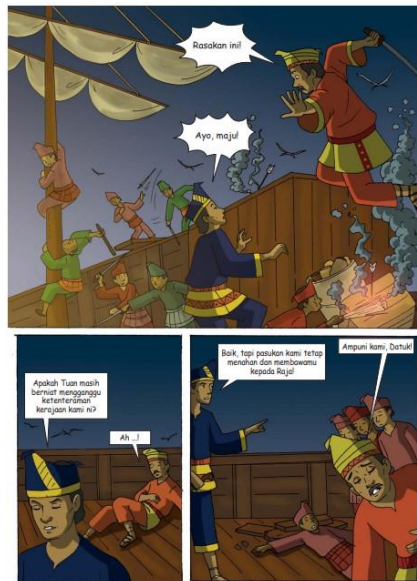
Gambar 2. Komik Datuk Hitam dan Bajak Laut halaman 6 (Prianto, Mutiara Budi; Fattahilah, 2020)

Pada gambar 1 digambarkan pengawal kerajaan sedang berdialog dengan Datuk Hitam (lihat teks 1, 2, 3 dan 4). Pada bagian ini, dialog sebagai teks verbal pada gambar tersebut memiliki signifikansi yang lebih kuat ketimbang teks visual dalam menyampaikan pesan nilai Pancasila. Artinya visual teks menjadi penanda dan (Prianto, Mutiara Budi; Fattahilah, 2020)n verbal teks menjadi petanda yang mewakili konsep. Hal ini berbeda pada gambar 2. Pada bagian tersebut verbal teks tidak memiliki signifikansi yang kuat, namun justru teks visual sebaliknya lebih memiliki signifikansi kuat (lihat gambar 2). Teks verbal pada gambar 2 dengan kalimat digunakan untuk memperkuat ilustrasi pertempuran antara Datuk Hitam dengan bajak laut dengan kemenangan ada pada Datuk Hitam.