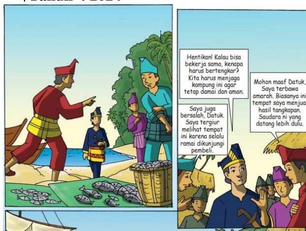
Gambar 3. Komik Datuk Hitam dan Bajak Laut halaman 2 (Prianto, Mutiara Budi; Fattahilah, 2020)

Pada ilustrasi komik signifikansi teks visual adalah menempatkan Datuk Hitam selalu pada posisi sentral atau tengah. Ilustrasi pertama Datuk Hitam sedang melihat dua pedagang berselisih, pedagang berpakaian merah dan pedagang pakaian biru. Pada ilustrasi adapula orang lain yang melihat menggunakan pakaian ungu, namun tetap posisi sentral ada pada Datuk Hitam. Pada ilustrasi kedua teks visual memperlihatkan Datuk Hitam berbicara kepada dua pedagang yang berselisih, mata memandang kepada pedagang berpakaian merah dan ada pula pedagang bertopi biru. Meski ada juga yang melihat dari kejadian tersebut, orang berpakaian ungu tidak berada di tengah. Ilustrasi posisi di bagian sentral atau tengah pada visual, biasanya menjadi headline atau pokok dalam suatu ilustrasi visual (Pandie & Ali, 2022). Dengan kata lain, posisi ilustrasi visual menunjukkan peran sentral Datuk Hitam.