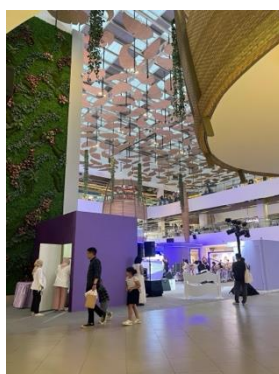
Gambar 9. Arsitektur Bangunan Dalam Mall Paskal 23 Dokumentasi: Tim Peneliti. 2025.