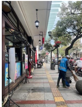
Gambar 5. Jalan Braga Dokumentasi: Tim Peneliti. 2025