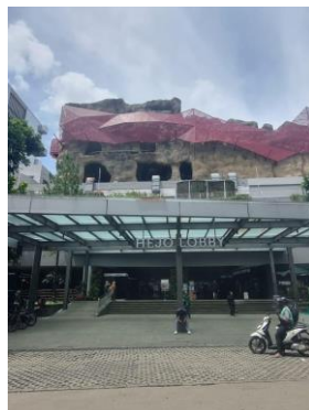
Gambar 6. Arsitektur Bangunan Mall Paskal 23 Dokumentasi: Tim Peneliti. 2025