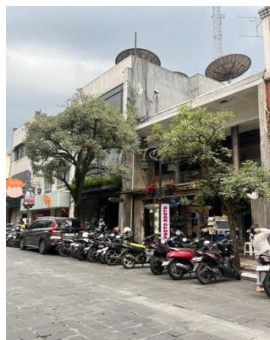
Gambar 2. Modernisasi Jalan Braga

Jawaban pengunjung: Menurut saya sudah sangat modern, namun mereka tetap tidak melupakan unsur budaya terutama seni. Contohnya banyak ornamen yang berhubungan dengan kebudayaan Indonesia seperti menggunakan ubin bermotif batik.