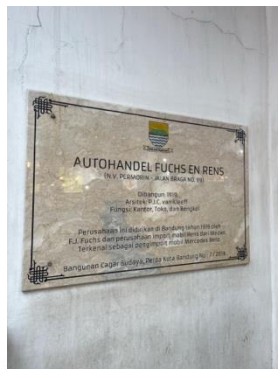
Gambar 3. Salah Satu Bukti Pembangunan Braga