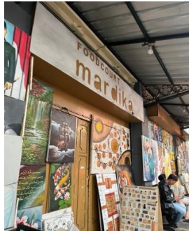
Gambar 4. Kegunaan Tempat Wisata Braga Dokumentasi: Tim Peneliti. 2025