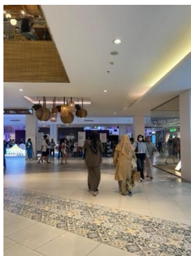
Gambar 8. Pola Lantai Batik Tradisional Mall Paskal 23