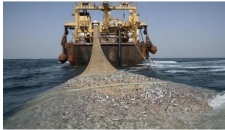
Gambar 2. Para nelayan saat menarik cantrang

Hal ini membuat para nelayan tradisional acap kali dicurangi oleh para nelayan modern maupun pengusaha cantrang yang menggunakan pukot harimau atau sejenisnya dalam mencari ikan. Saat ini penggunaan pukot harimau masih dilarang kendati dalam waktu dekat akan dilegalkan (Andriansyah, 2020). Para nelayan yang menggunakan cantrang dalam menangkap ikan, hasil tangkapannya tidak selektif karena menangkap semua biota laut yang tentu saja dapat mengancam keberlanjutan sumber daya serta dapat memperhambat proses recruitment , bahkan dapat menimbulkan konflik di antara nelayan yang menggunakan cantrang dengan nelayan yang tidak menggunakan cantrang (FAQ Kebijakan Pelarangan Cantrang, 2017). Berdasarkan data statistik dari Kementerian Kelautan dan Perikanan (KKP), cantrang dan trawl telah mencapai 91.931 unit ditahun 2011 (Habibi, 2015)