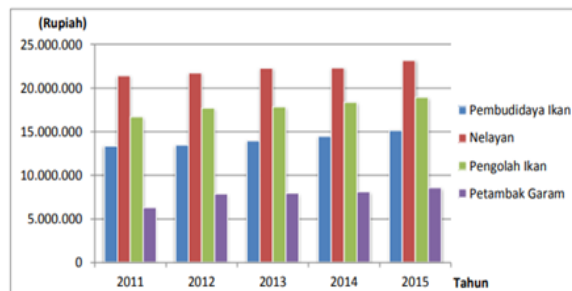
Gambar 4. Grafik Perkembangan Pendapatan Pembudidaya Ikan, Nelayan dan Petambak Garam Tahun 2011 sd. 2015 (Renstra Dinas Perikanan Kabupaten Karawang Tahun 2016-2021, 2021)

Dari kedua grafik tersebut pihak Dinas Perikanan setidaknya telah meningkatkan kesejahteraan para nelayan melalui program perikanan tangkap laut, dengan menyediakan sarana dan prasarana di setiap Tempat Pelelangan Ikan (TPI) ataupun menyalurkan bantuan berupa Alat Penangkapan Ikan (API) bagi nelayan di sepanjang pesisir agar dapat meningkatkan pendapatan serta produksi para nelayan saat ini. Terlihat pada grafik perkembangan pendapatan dari para nelayan cukup mengalami peningkatan secara signifikan selama kurun waktu 5 (lima) tahun. Sedangkan terkait jumlah produksi perikanan tangkap mengalami fluktuasi sebab faktor cuaca yang tak dapat terprediksi sebelumnya serta melonjaknya harga Bahan Bakar Minyak (BBM) yang membuat para nelayan tidak melaut sampai keadaan normal kembali.