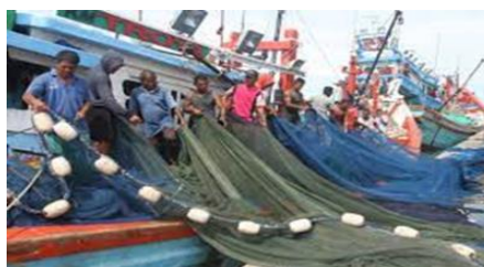
Gambar 1. Penggunaan Cantrang saat menangkap ikan

Cantrang adalah alat tangkap ikan yang menyerupai kantong besar yang mengerucut serta dioperasikan pada dasar perairan. Ikan demersal merupakan target cantrang. Ikan jenis tersebut memiliki nilai ekonomis yang sangat tinggi (Aji et al., 2013). Selain ikan demersal adapula ikan petek, biji nangka, gulamah, kerapu, pari, cucut, gurita, bloso dan macam-macam udang yang merupakan hasil tangkapan cantrang (Subani & Barus, n.d.). Cantrang dapat mempersingkat dalam penangkapan ikan. Jika dibandingkan dengan alat penangkap ikan lainnya seperti gilnet yang membutuhkan waktu sampai 104,60 jam, kegiatan penangkapan ikan menggunakan cantrang hanya membutuhkan waktu lebih singkat yaitu sekitar 74,40 jam (Sutanto, 2005).