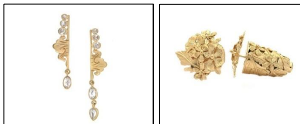
Gambar 2. Anting Panjang ( chandelier ) dan Subang fine jewelry berbahan dasar logam emas kuning 18 karat, campurannya terdiri dari 75% emas murni, 15% tembaga dan 10% fine silver dengan batu berlian round dan oval cut . Bentuk perhiasan yang cenderung mengarah pada bentuk-bentuk feminim, nuansa mewah dan penuh unsur muatan kenangan akan sebuah ikatan emosional tertentu. (Sumber gambar: koleksi pribadi)

Kemudian dalam hasil wawancara yang lain dengan Yanna (46 tahun, analis keuangan), diperlihatkan bahwa masalah rumah tangga, terutama terkait suaminya yang sering berselingkuh, menjadi alasan mengapa dirinya senantiasa perlu untuk menghibur diri, terutama lewat konsumsi perhiasan. Berangkat dari persoalannya tersebut, Yanna kemudian memilih perhiasan dengan bentuk sederhana namun mengandung bahan berkualitas mahal seperti emas putih atau emas murni dengan batu berlian atau permata asli. Bentuk perhiasan yang digunakan oleh Yanna adalah sebagai berikut: