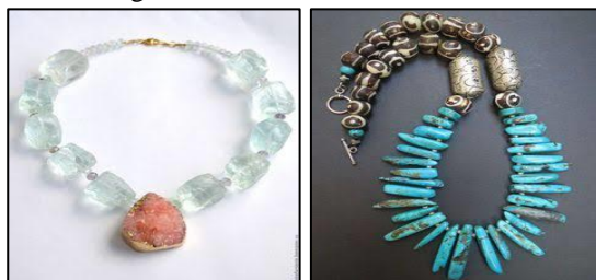
Gambar 3. Kalung berbahan dasar batu quartz (kuarsa), gold plated dan batu alam turquoise , tribal glass beads dan sterling silver (perak 925). Perhiasan yang dipilih cenderung mengarah pada bentuk-bentuk feminim sekaligus kuat namun berkesan ramah, ceria dan mewakili spirit kebebasan.

Dalam wawancara berikutnya dengan Ratna Sari (27 tahun, manajer keuangan), ia menunjukkan sifat impulsif dalam berbelanja, sehingga condong untuk membeli hal-hal berdasarkan keinginan sesaat saja dan bukan atas pertimbangan kebutuhan. Terlebih lagi, ia sangat mudah terdorong berbelanja karena iklan-iklan tertentu. Berdasarkan kecenderungan tersebut, maka Ratna Sari cenderung memilih perhiasan dengan bentuk-bentuk feminim dengan nuansa ceria dari bahan berkualitas baik dan bisa terbuat dari bahan apapun asalkan desainnya menarik. Bentuk perhiasan yang digunakan oleh Ratna Sari adalah sebagai berikut: