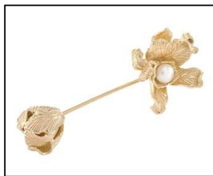
Gambar 6. Bunga lotus (long pin gold dip with white pearl). Bahan: perak sterling silver sepuh emas 18 karat dan mutiara putih. Bunga lotus adalah tumbuhan tahunan yang hidup dan tumbuh di tanah berlumpur atau di atas air. Dalam kebudayaan Hindu, lotus melambangkan sifat-sifat tertentu, antara lain. Lotus putih yang memiliki arti kemurnian pikiran dan ketenangan sifat manusia dan kesempurnaan spiritual. (Sumber gambar: tulola design)

Bentuk perhiasan yang digunakan oleh penulis adalah sebagai berikut: