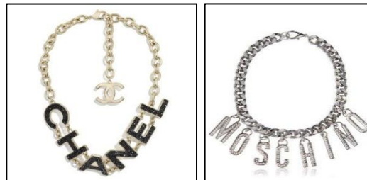
Gambar 4. Kalung choker custom jewelry berbahan dasar berlian jenis princess cut dan platinum rhodium plated . Bentuk perhiasan yang cenderung mengarah pada bentuk-bentuk feminim dengan kesan mewah, ceria, percaya diri, menonjol dan menarik perhatian.

Wawancara lainnya, dengan Maya Barbie (32 tahun, artis sinetron, pemilik butik) menunjukkan bahwa statusnya sebagai istri kedua yang cenderung diabaikan oleh suaminya, membuat dirinya mengkompensasikan kondisi tersebut pada pemenuhan kebutuhan akan barang-barang mewah dengan bahan berkualitas tinggi dengan brand terkenal yang bisa meningkatkan status sosial. Bentuk perhiasan yang digunakan oleh Maya Barbie adalah sebagai berikut: