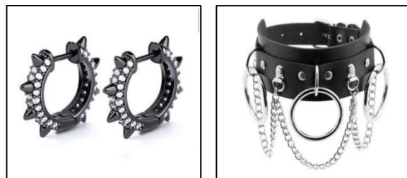
Gambar 5. Jenis perhiasan anting dan kalung custom jewelry, berbahan dasar logam titanium hitam dan rantai perak ( sterling silver 925) dan batu zircon. Bentuk perhiasan yang cenderung mengarah pada bentuk yang memiliki kesan lugas, kuat, edgy, namun sekaligus juga ekspresif.