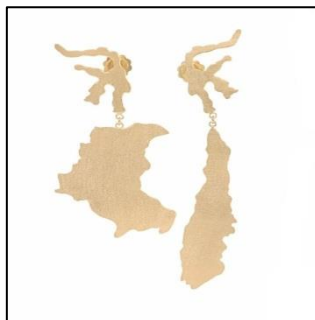
Gambar 7. Chandelier (anting gantung). Bahan: perak sterling silver bersepuh emas 18 karat dan mutiara putih. Mencerminkan keindahan dan kebanggaan sebagai bangsa Indonesia yang merupakan negara kepulauan Indonesia juga merupakan negara yang kaya akan keanekaragaman hayati serta panorama alam yang indah, baik pegunungan maupun lautan. Keanekaragaman merupakan kekayaan bangsa. Terutama untuk Indonesia, Indonesia terdiri dari beragam suku, budaya, agama. Kita harus menjadikan keberagaman sebagai kekayaan bangsa. Sebab keragaman kita tidak dimiliki oleh negara lain.