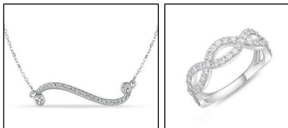
Gambar 1. Kalung dan cincin fine jewelry dengan bahan dasar emas putih dan batu berlian cushion cut persegi dengan sudut membulat. Bentuk perhiasan yang cenderung mengarah pada bentuk-bentuk feminim, mewah, tegas namun sederhana, mencerminkan bukti kemadirian dan keamanan diri secara finansial.