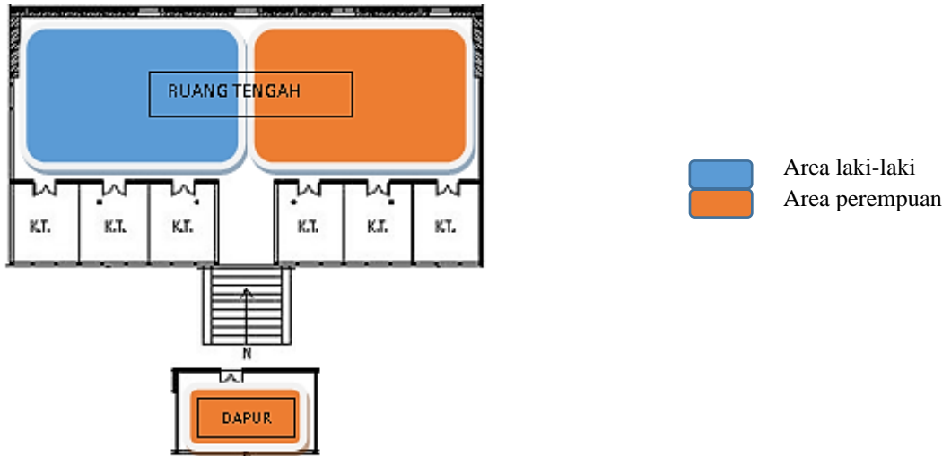
Gambar.1. Pembagian area laki-laki dan perempuan pada rumah gadang (Sumber: Penulis, 2021)

Tradisi makan bajamba dipercaya masih memiliki nilai sosial yang tinggi khususnya gotong-royong, serta tujuan mulia tradisi yaitu untuk kebersamaan serta memepererat simpul silaturahmi di antara masyarakat (Hafizh, 2018).