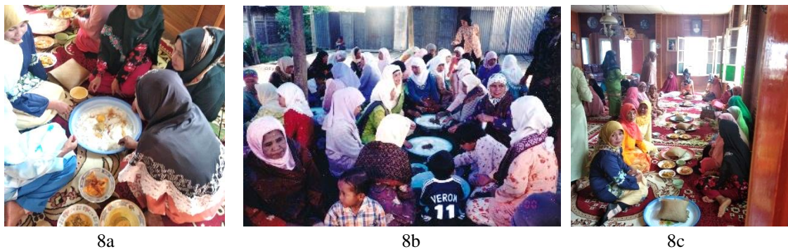
Gambar 8. a,b,c Suasana makan bajamba pada kelompok perempuan