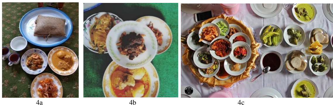
Gambar 4. a,b,c Jenis makanan yang dihidangkan pada saat makan bajamba .

Adakalanya makanan dibawa oleh kerabat untuk dimakan bersama. Makanan diletakan dalam dulang , dibawa di atas kepala oleh kaum perempuan (gambar 5).