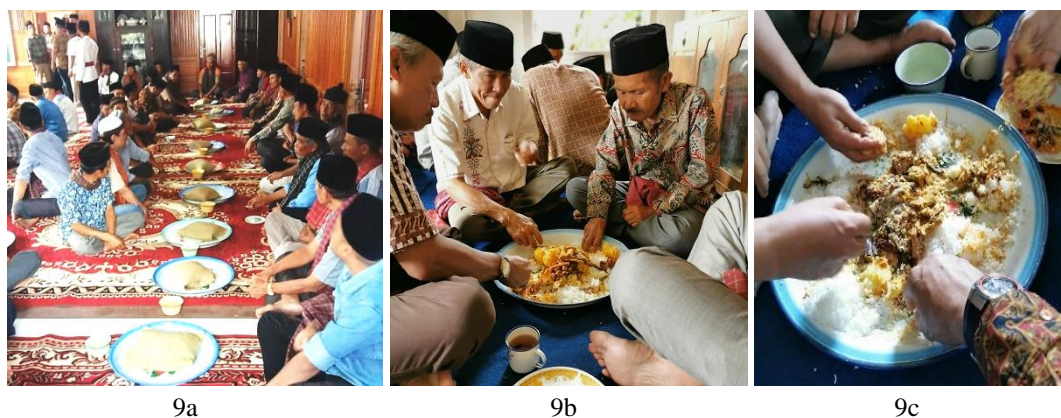
Gambar 9. a, b, c Suasana makan bajamba pada kelompok laki-laki