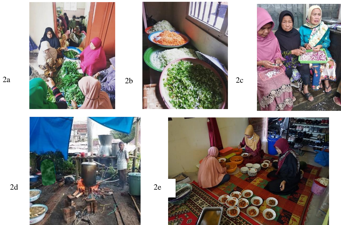
Gambar 2. a,b,c,d,e Kegiatan memasak utamanya dilakukan oleh kaum perempuan. Dibantu oleh laki-laki untuk memasak dalam ukuran besar, seperti: menanak nasi (2d).

Hasil penelitian Ade Syahputra yang berjudul: Makna Simbolik Prosesi Makan Bajamba dalam Baralek Adat Minangkabau di Desa Baso, Kabupaten Agam, Provinsi Sumatera Barat , menyimpulkan bahwa situasi simbolik dalam prosesi makan bajamba di Desa Baso memiliki makna, terdiri dari objek fisik dan objek sosial