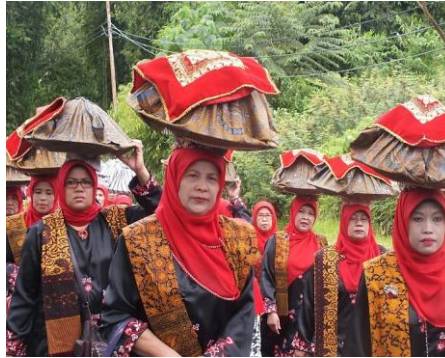
Gambar 5 Kaum perempuan membawa dulang di atas kepala

Tradisi makan bajamba sarat akan makna, seperti nilai-nilai kebersamaan. Satu wadah untuk makan bersama-sama tanpa membedakan status. Dalam tradisi ini juga terdapat manfaat seperti melatih diri untuk saling berbagi, menghormati dan mendahulukan orang yang lebih tua .